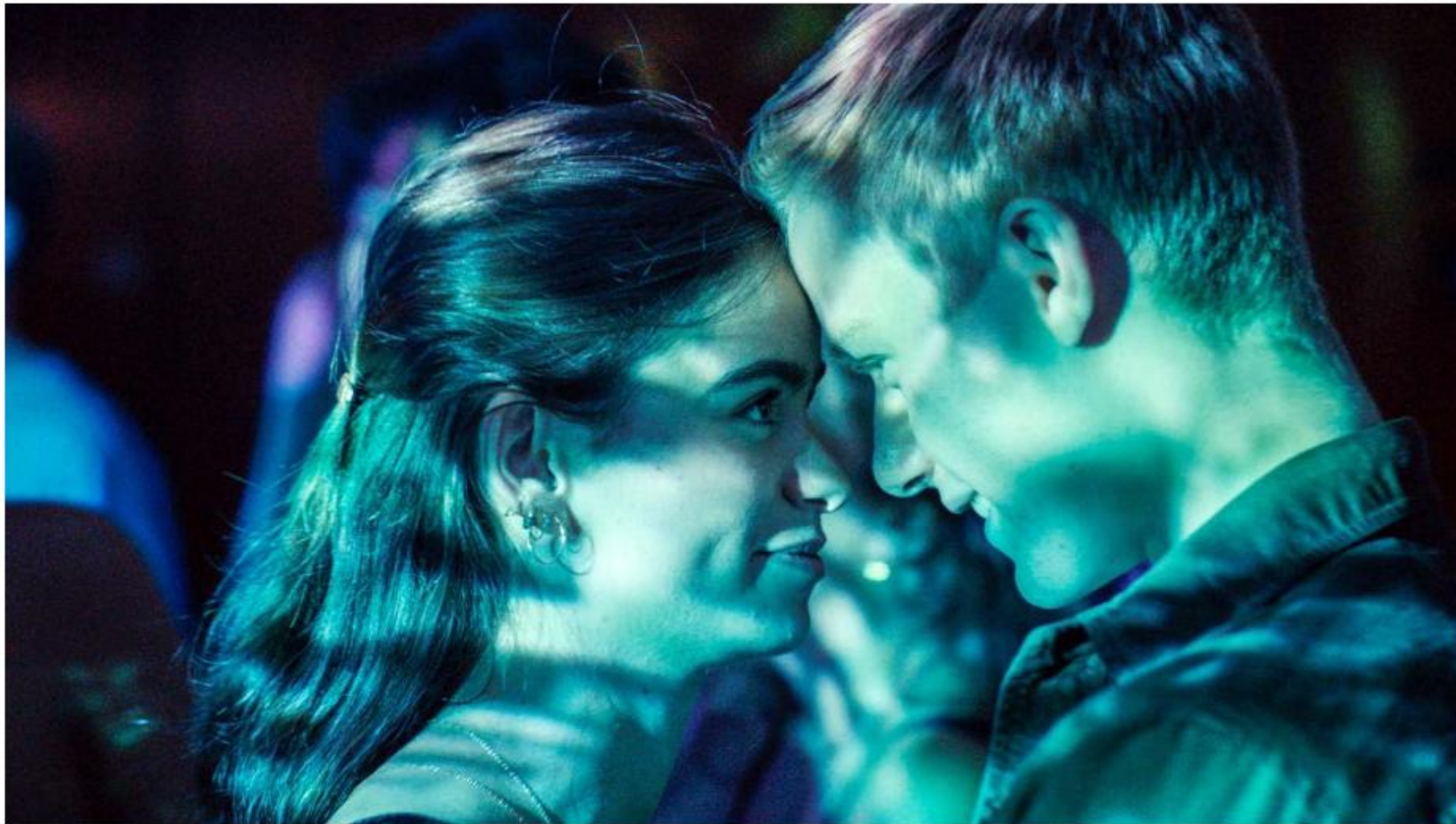
Bilde: «Natten til lørdag», DR. Gjengitt med tillatelse.