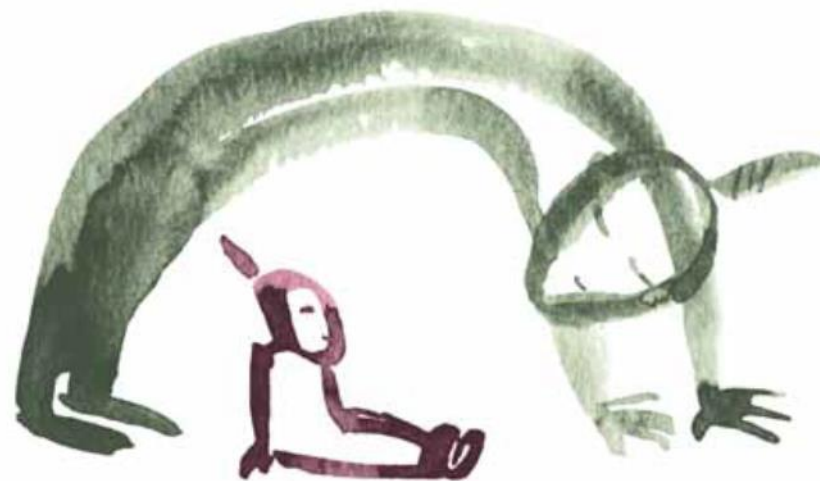
Bildet er laget av Ingri Egeberg